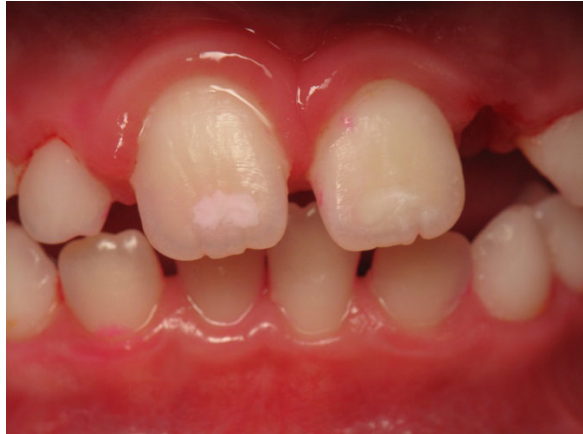
Patient Nr. K005 – BILD 4c