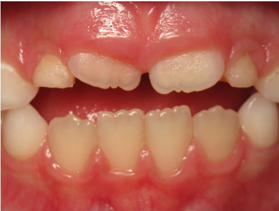
Patient Nr. K002 – BILD 2