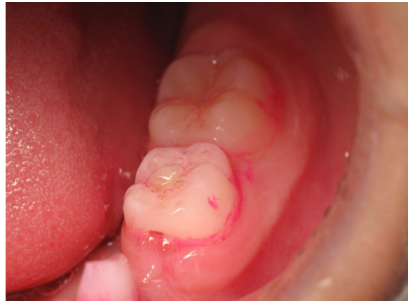
Patient Nr. K006 – BILD 5b