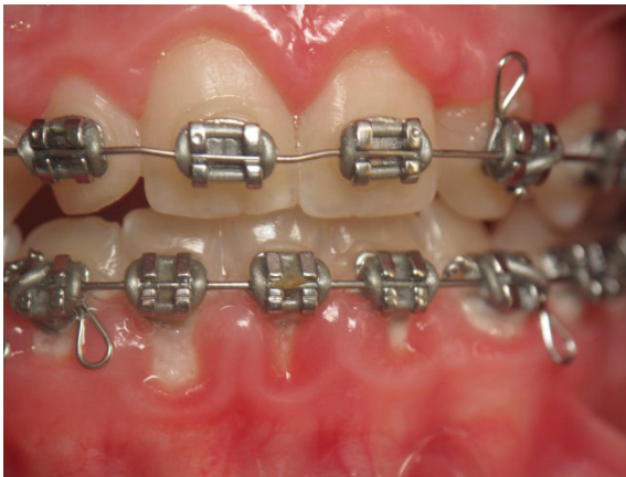
Patient Nr. K004 – BILD 3c