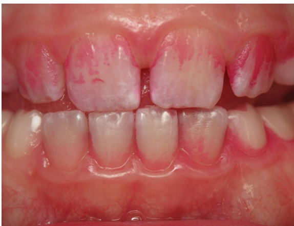
Patient Nr. K013 – BILD 7a