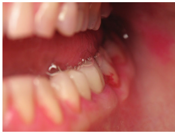
Patient E020 – BILD 9b