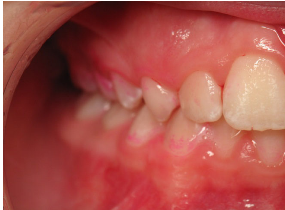
Patient Nr. K012 – BILD 6d