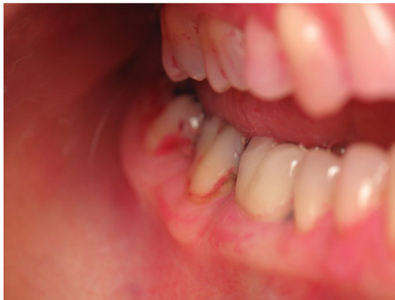
Patient Nr. E020 – BILD 9c