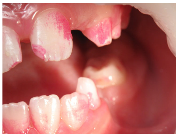
Patient Nr. K006 – BILD 5d