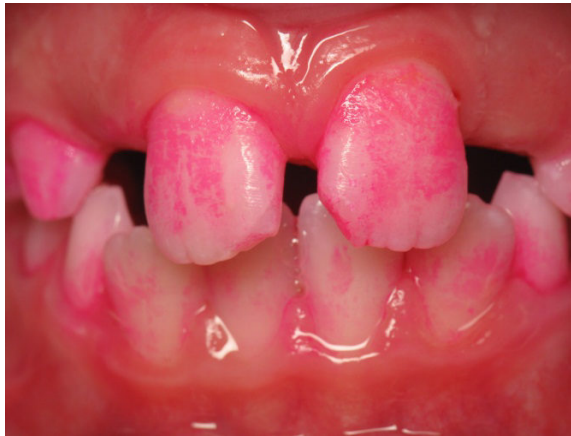
Patient Nr. K006 – BILD 5a