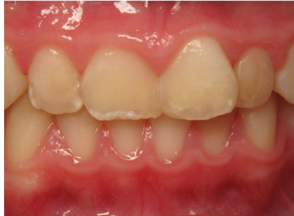
Patient Nr. K019 – BILD 8b