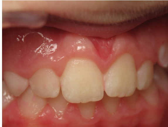
Patient Nr. K012 – BILD 6b