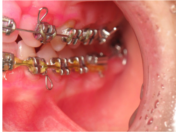
Patient Nr. K004 – BILD 3b