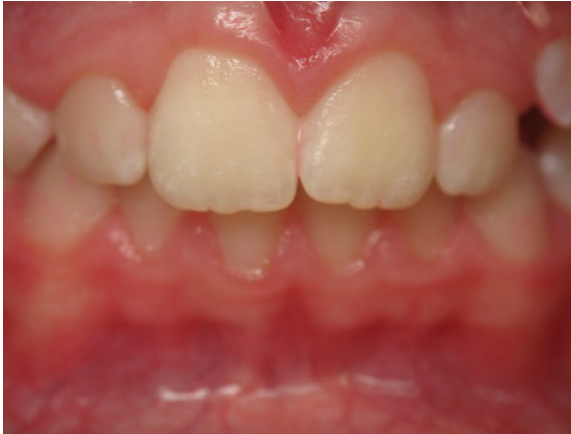
Patient Nr. K012 – BILD 6a