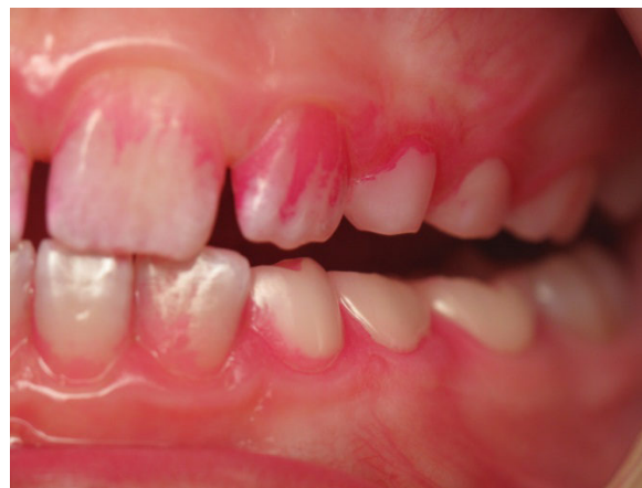
Patient Nr. K013 – BILD 7b