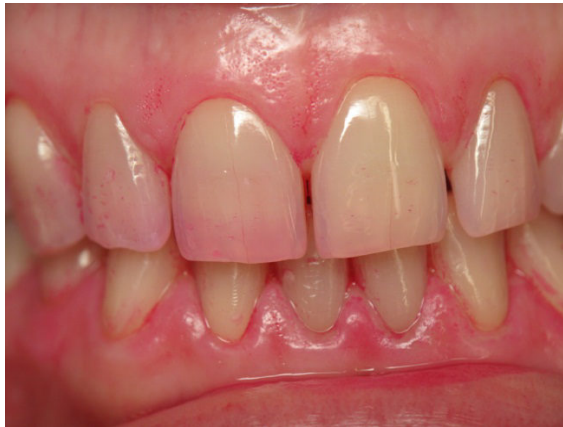
Patient Nr. E020 – BILD 9a