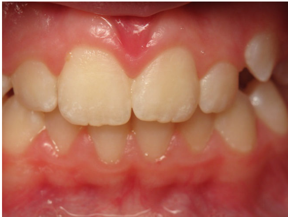
Patient Nr. K012 – BILD 6c