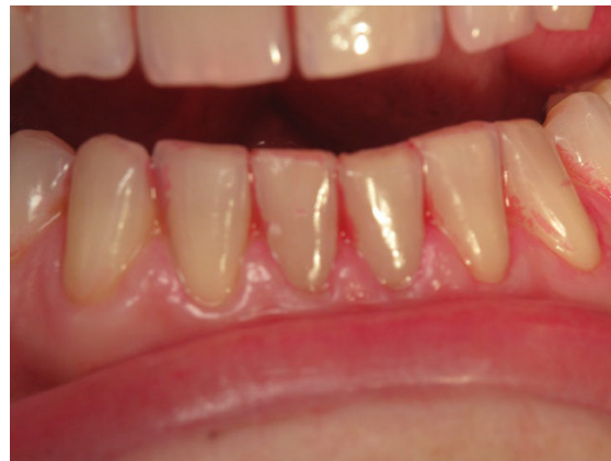
Patient Nr. E020 – BILD 9d