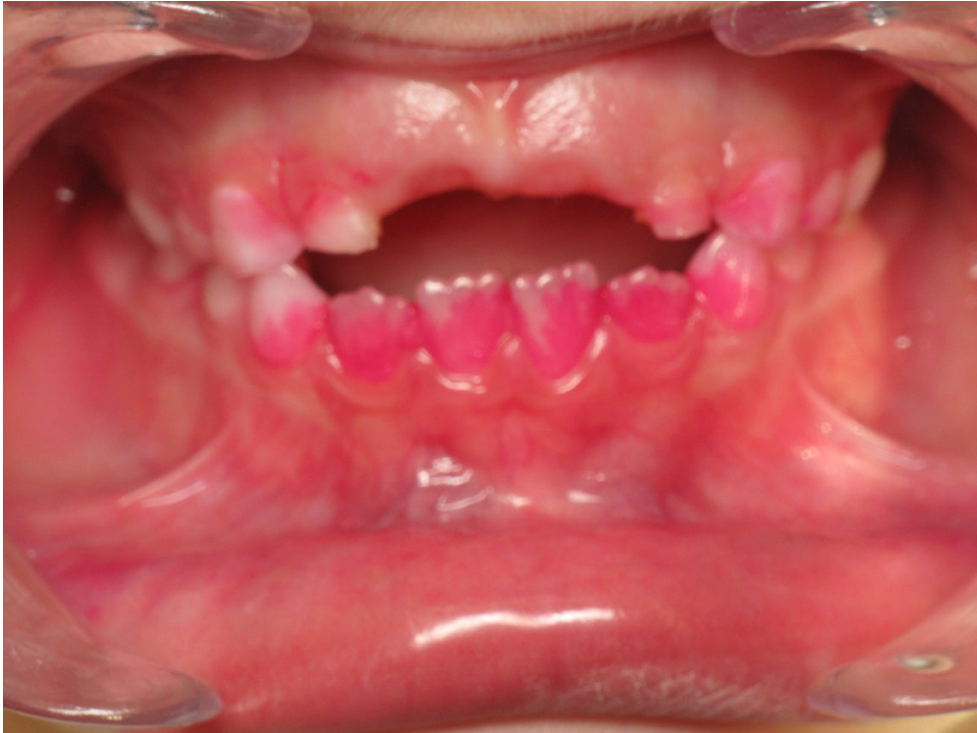
Patient Nr. K002 – BILD 1