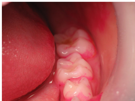
Patient Nr. K005 – BILD 4b