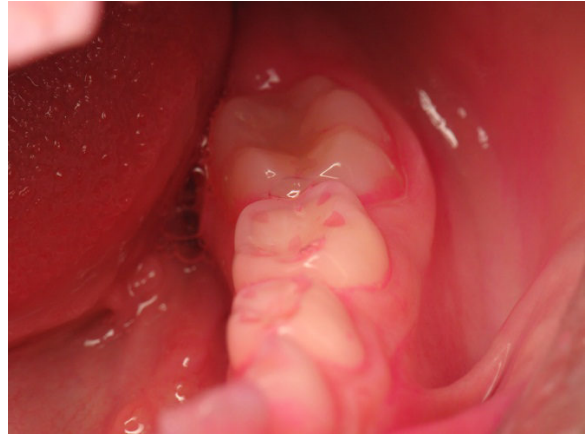
Patient Nr. K013 – BILD 7d