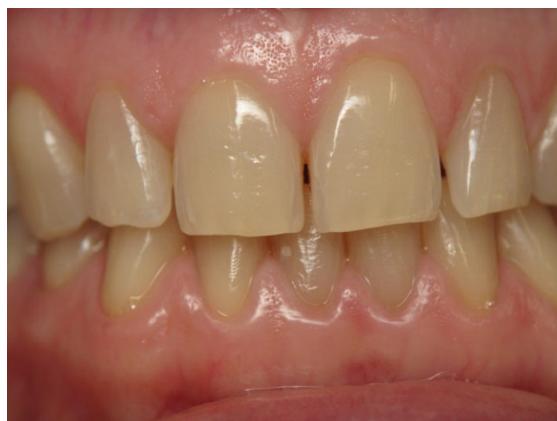
Patient Nr. E020 – BILD 9e