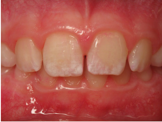
Patient Nr. K013 – BILD 7c