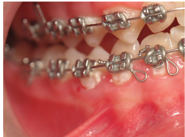
Patient Nr. K004 – BILD 3d