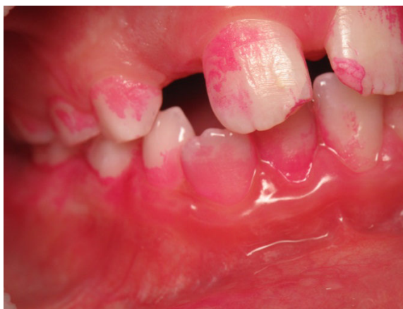
Patient Nr. K006 – BILD 5c