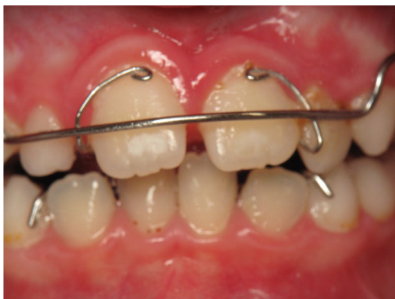
Patient Nr. K005 – BILD 4a