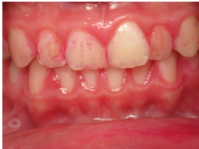
Patient Nr. K019 – BILD 8c