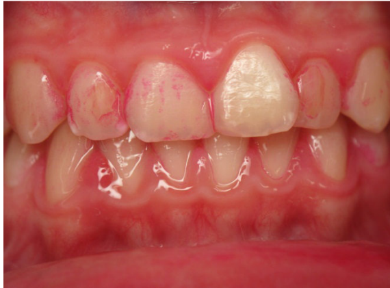
Patient Nr. K019 – BILD 8a